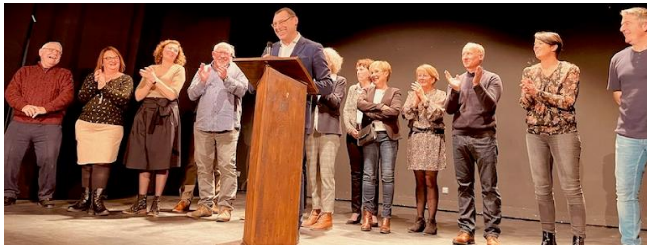
Cérémonie des vœux de la municipalité 2023

« En trois ans et malgré le Covid, le village s'est embelli, donnant encore plus de charme à notre commune : éclairage en led, quatre rues rénovées, des massifs de fleurs et arbustes, des plantations d'arbres, des parvis en pierre devant la mairie et l'église, l'enclos revigoré de la mairie, un parcours pédagogique naturel et la salle des fêtes modernisée et agrandie d'une scène de spectacles. » A ce bilan à mi-mandat de l'équipe municipale, il faut associer également les actions de participation citoyenne et des associations. Tout au long de 2022, le village a connu plus de vingt animations, quasiment toutes gratuites... Magny sur Tille, village nature, numérique et animé. Sa transition écologique et énergétique se poursuivra en 2023 et 2024 avec le doublement de la forêt biodiversifiée au verger, des agrès sportifs de plein air, le développement de l'agriculture Bio sur le domaine agricole communal, de la production d'énergie photovoltaïque...et toujours aussi des travaux de voirie rue du Petit Montant en 2023, rue du lavoir en 2024 et des études pour sécuriser la traversée du village rue grande... et plus encore,